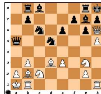
dg.6 – ČNT mat 4.tahem