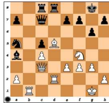
dg.2 – BNT mat 3.tahem