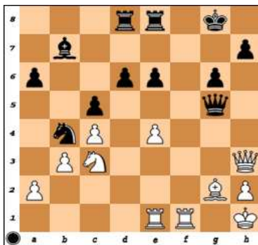
dg.3 – BNT po 3. tahu jasno