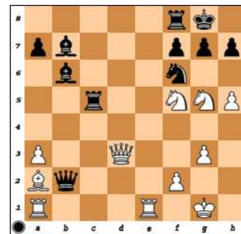
dg.4 – ČNT mat 3.tahem