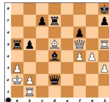
dg.8 – ČNT mat 3.tahem