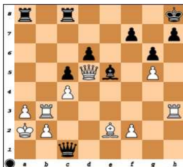
dg.7 – BNT mat 3.tahem